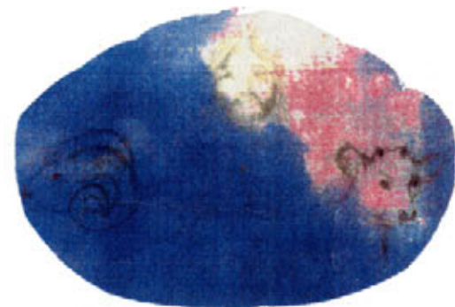
Isaiah 53: 10

"ויהוה חפץ דכאו החלי אם-תשים אשם נפשו יראה זרע יאריך ימים וחפץ יהוה בידו יצלח." (ישעיה, נג:י')